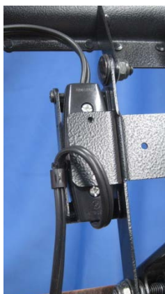
修正後の状態（裏側）

引っ張り出された導線部分を正常な状態に整えた後、電源コードの重さが直接末端の端子部分に掛からない様に電源コードを一旦別の場所に固定する。